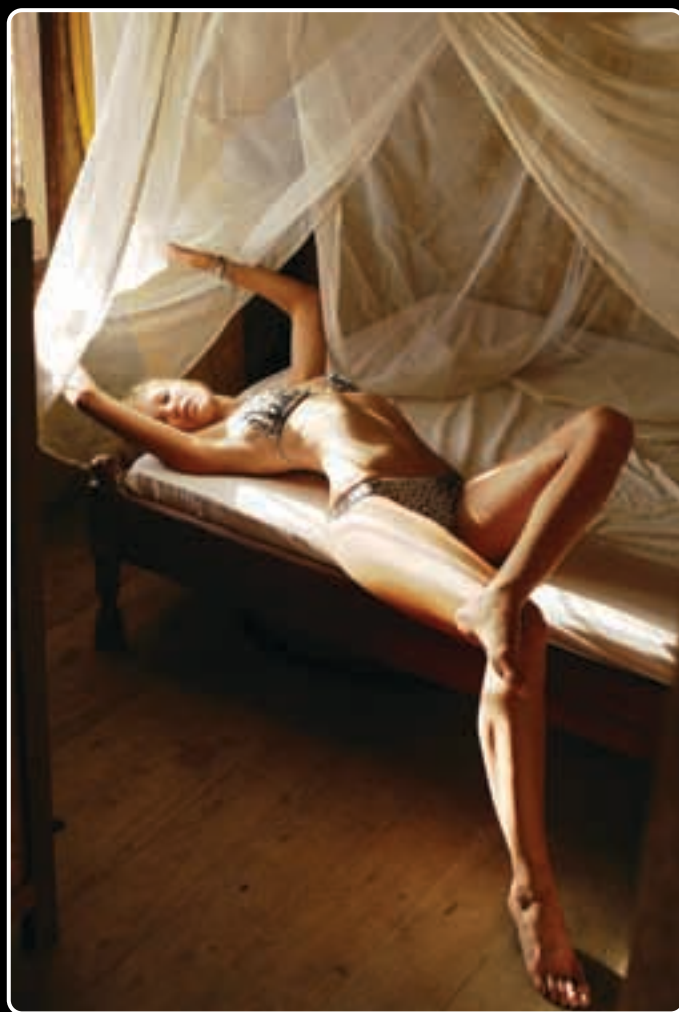
Sopra Altre due splendide modelle fotografate da Benedusi per Sports Illustrated . Anche qui risaltano la semplicità dell'impianto figurativo e l'uso della luce diffusa, cifre stilistiche dell'autore. Nella pagina seguente Due immagini pubblicitarie realizzate in Portogallo per i jeans Bus.

fessionista quando riesci a visualizzare dentro di te la storia che racconterai poi con le immagini. Un fotografo, per quanto bravo, non ha un progetto: magari scatta foto bellissime, ma casuali. Il professionista, invece, è sempre uno che ha qualcosa dentro di sé da raccontare, qualcosa che ha pensato prima di premere il bottone. Per questo dico sempre che è meglio una brutta foto ma con un'idea dietro, che una foto bella ma senza nessun presupposto, scattata in modo casuale. Oggi è molto facile realizzare foto tecnicamente corrette. Se diamo a una scimmia una fotocamera e le insegniamo a schiacciare il pulsante, la scimmia porterà senz'altro a casa una foto carina, fatta bene".