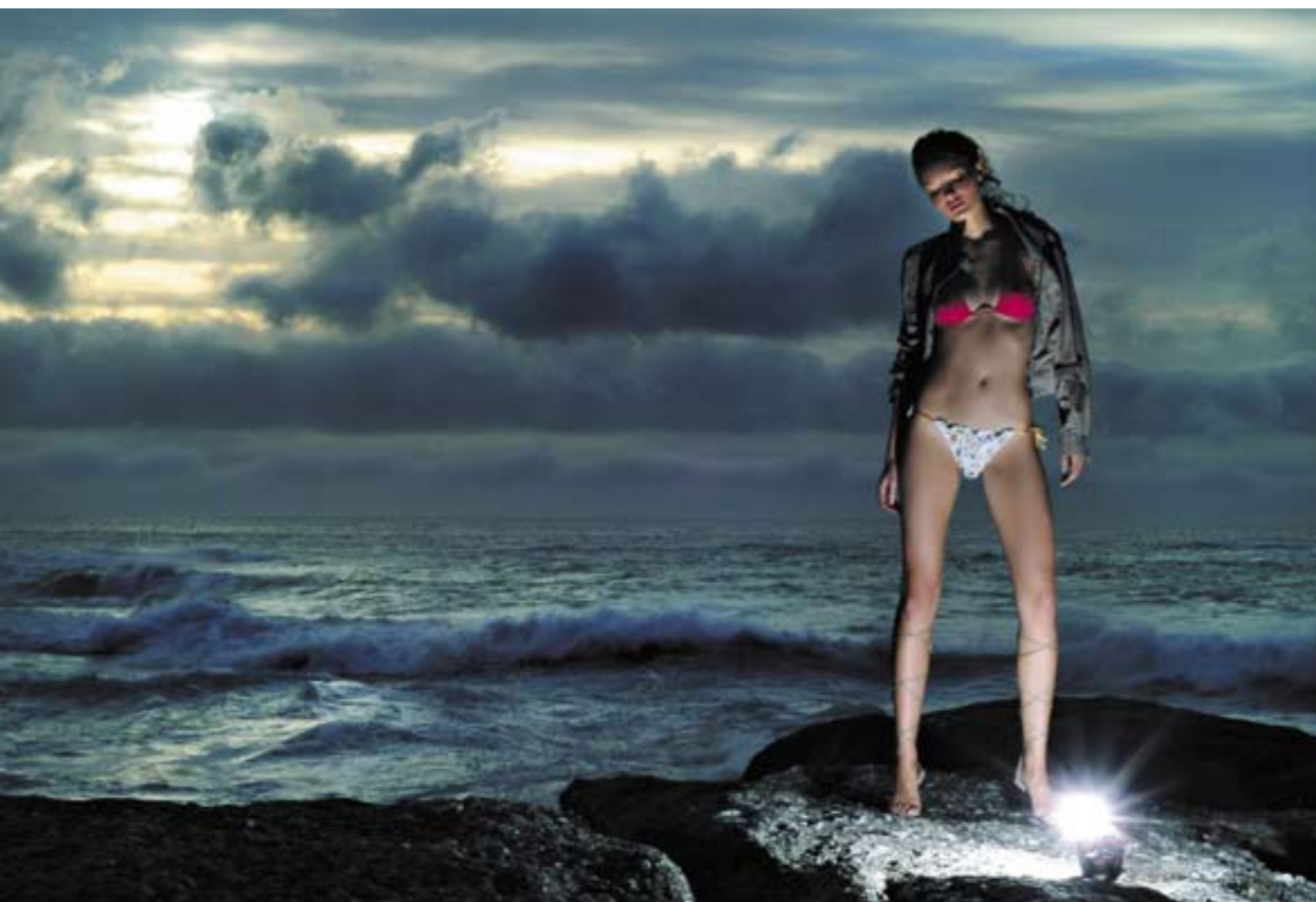
Un'immagine di grande effetto per la quale è stata utilizzata la torcia del generatore flash, cancellato in post-produzione. Benedusi ha curato la posa in maniera da sotto-esporre lo sfondo.

Nel 1979, Settimio era uno studente liceale; amava il mondo, con passione e curiosità; allo stesso modo, amava la fotografia e, come molti fotoamatori impegnati, cercava di capire il perché delle cose ed analizzava il linguaggio fotografico con un taglio umanistico; lettore assiduo di Progresso Fotografico , scrive alla sua rivista una lunga lettera, a cui Beppe Alario risponde: “Settimio, hai speso bene i tuoi diciassette anni” . Questa risposta colpisce Settimio nel profondo, accrescendo il suo entusiasmo, ed il desiderio di portare avanti la sfida. Così, terminati gli studi, parte dalla sua Imperia per trasferirsi a Milano e tentare la sua scommessa: la fotografia come strada di vita e professione. Giunto in città acquista numerose riviste in edicola e inizia ad analizzarne il tipo di