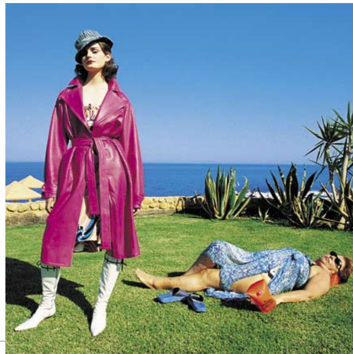
La realizzazione di redazionali per le riviste italiane richiede di ingegnarsi per venire incontro alla necessità di contenere il budget. La redazione aveva organizzato una piccola produzione per capi di mare a Sharm el Sheik; approfittando della trasferta, hanno affidato a Benedusi anche una serie di capi invernali. Dopo alcuni momenti di perplessità per come ambientare questi capi al sole del Mar Rosso, Benedusi ha dato corpo all'idea (è sempre l'idea a costruire l'immagine): un'ambientazione surreale per la modella che indossa capi invernali sullo sfondo delle scene quotidiane del turismo di Sharm.

sue capacità. E così, con calma e metodo, inizia una trafila che ora, in tempi di digitale, fa sorridere: fa una serie di rullini test variando esposizione ed altri parametri, facendo reggere al modello un cartellino con un numero differente per ogni rullo; annota su un foglio i dati tecnici e li manda a sviluppare. Al ritorno dei test, analizza le immagini sulla base degli appunti presi e ri-allestisce tutto apportando le modifiche necessarie. Dopo qualche giorno di lavoro riparte per Milano con il suo servizio. Durante il viaggio, diceva fra sé e sé: “o la va, o la spacca” , riponendo nel risultato di quel primo test la decisione sul futuro della sua vita: dato che studiava giurisprudenza, se il servizio non fosse piaciuto, avrebbe percorso la carriera forense.