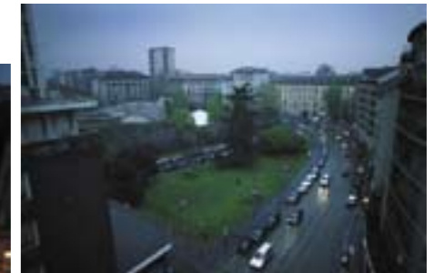
Questo redazionale è stato realizzato per la bella rivista d'arte ed avanguardia "Uovo", che lascia al fotografo piena libertà nell'ideazione delle storie fotografiche. Benedusi ha utilizzato il sottile ed efficace artificio della contrapposizione, della "dissonanza" fra elementi dell'immagine. Una splendida modella in un ambiente squallidamente modesto, una pensioncina da poco. Avvolta nel mistero (perché è lì? cosa sta facendo?), la modella viene contrapposta a paesaggi urbani dimessi e grigi.