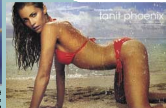
Per realizzare questo scatto, con l'acqua che cade a pioggia sulla modella, è stata trasportata in loco una "rain-machine", una macchina per la simulazione della pioggia usata in cinematografia.