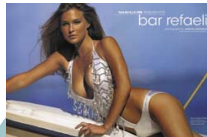
Le produzioni di Benedusi per Sports Illustrated hanno il sapore della produzione cinematografica; questi scatti sono stati seguiti da troupe di 45-50 persone, che curavano ogni aspetto della realizzazione, documentandolo anche con video e trasmissioni radio. Anche le modelle sono di assoluto rilievo; Bar Rafaeli è diventata nota al vasto pubblico come la nuova compagna di Leonardo Di Caprio.